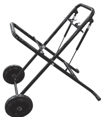
651 подставка (опция)