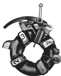
Резьбонарезная головка №424 (стандарт)