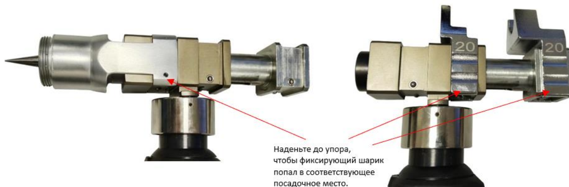
Рис. 1 Правильная установка расширительного адаптера и запрессовочных тисков на аксиальном прессе

Внимание! Во избежание поломки расширительного адаптера и запрессовочных тисков, убедитесь, что они установлены правильно на аксиальном прессе (Рис.1). Они должны быть зафиксированы в соответствующих пазах при помощи утапливаемых стальных шариков. Неправильная установка ведет к деформации и последующей поломке расширительного адаптера и запрессовочных тисков.